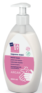
Sapone mani Hand wash

Prodotto cosmetico per una frequente pulizia delle mani. Contiene Olio di Argan.