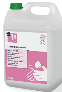
Crema lavamani Hand cream

Prodotto cosmetico in crema con glicerina vegetale.